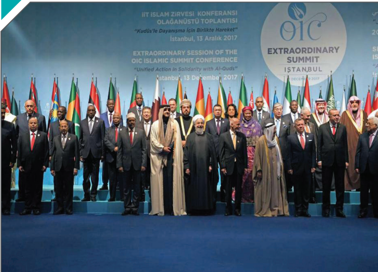
IT ISLAM ZIRVESI KONFERANSI OLAGANUSTU TOPLANTISI "Kudüs'te Dayanışma İcin Birlikte Hareket" İstanbul, 13 Aralık 2017 EXTRAORDINARY SESSION OF THE OIC ISLAMIC SUMMIT CONFERENCE "Unified Action in Solidarity with Al-Quds" İstanbul, 13 December, 2017

دارند، زمینه‌های لازم را برای اجماع‌سازی‌های منطقه‌ای فراهم می‌کنند. از آن جایی که برخی از ظرفیت‌های مهم جهانی همچون انرژی نیز در منطقه غرب آسیا وجود دارد، اهرم‌های فشار لازم برای اجرایی ساختن تصمیمات کشورهای اسلامی موجود است. بر این اساس فعال‌سازی سازمان همکاری اسلامی برای تامین منافع کشورهای اسلامی به ویژه فلسطین گام موثری در این راستا ارزیابی می‌شود. استراتژی محور مقاومت به رهبری جمهوری اسلامی ایران با همراهی کشورهای دوست می‌تواند پروژه‌های عبری - آمریکایی را ناکام گذارد؛ چنانچه پروژه‌های سال‌های اخیر آن‌ها با شکست مواجه شده است. چنین ناکامی باعث شده است که واشنگتن متحدان منطقه‌ای خود را به یک جنگ نیابتی وارد سازد که تاکنون هیچ سودی به حال آن‌ها نداشته است. در حقیقت آمریکا بدون همراهی متحدان منطقه‌ای خود از پیشبرد سیاست‌های یک‌جانبه عاجز خواهد بود؛ چرا که واشنگتن و رژیم صهیونیستی به دنبال هزینه‌های عشی که طی سال‌های متمادی در منطقه داشته‌اند، به دستاورد قابل ملاحظه‌ای دست نیافته‌اند. حال اجماع کشورهای اسلامی سیاست‌های آتی آن‌ها را نیز ناکام خواهد گذاشت.