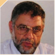
شهید دکتر عبدالعزیز رنتیسی

عبدالعزیز علی عبدالحفیظ الرنتیسی در سال ۱۳۲۶ در روستای مینا در فلسطین دیده به جهان گشود. او از دانشکده پزشکی دانشگاه اسکندریه موفق به دریافت مدرک لیسانس شد و پس از آن در همین دانشکده به عنوان متخصص اطفال فارغ تحصیل شد، رنتیسی یکی از بنیانگذاران جنبش مقاومت اسلامی حماس در غزه در سال ۱۳۶۶ بود. وی بارها از سوی صهیونیستها دستگیر و زندانی شد. دکتر رنتیسی در سلول انفرادی کل قرآن کریم را حفظ کرد. پس از ترور شیخ احمد یاسین رهبری حماس در داخل جنبش به رنتیسی سپرده شد. سرانجام نیز در سال ۱۳۸۳، اتومبیل او در شمال غزه به وسیله موشک بالگردهای ارتش رژیم صهیونیستی مورد هدف قرار گرفته و رنتیسی به همراه فرزند و محافظش در سن ۵۷ سالگی به شهادت رسید.