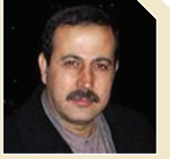
شهید محمود المبحوح

محمود عبدالرؤوف محمد المبحوح در ۱۴ فوریه سال ۱۹۶۰ میلادی دیده به جهان گشود. دوران طفولیت و نوجوانی خود را در همان اردوگاه جبالیه که به اردوگاه انقلاب و پایداری معروف است گذراند. او در جوانی به حماس پیوست و مبارزه خود را با قدرت آغاز کرد. در سال ۱۹۸۶ به مدت یک سال بازداشت شده و به اتهام همراه داشتن سلاح کلاشیکوف در زندان مرکزی غزه حبس شد. وی در ادامه شاخه نظامی حماس را راه اندازی کرد و عملیات‌های مختلفی علیه اشغالگران به اجرا در آورد که از جمله آنها چند اقدام موفق اسیرگیری از ارتش رژیم صهیونیستی بود. صهیونیست‌ها بارها برای ترور وی اقدام کردند اما موفق نبودند و وی موفق به خروج از غزه شد اما سرانجام در سال ۲۰۱۰ در دبی به شهادت رسید.